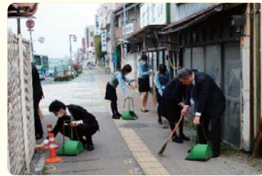
クリーン作戦(小山営業部)