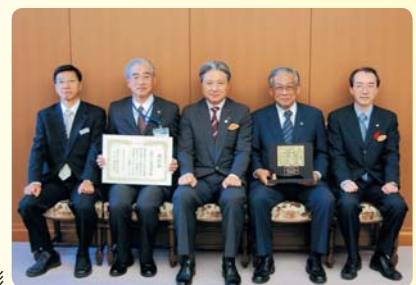
栃木県知事より表彰