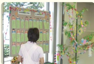
園児による七夕飾りをロビーに展示(野木支店)