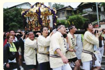
八幡宮八坂神社みこし渡御(八幡支店)