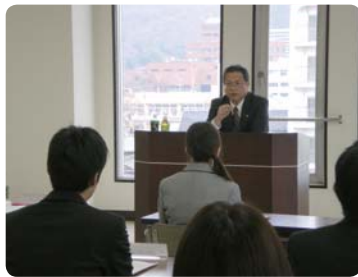
新人職員コンプライアンス研修会

コンプライアンスの実践計画書として「コンプライアンス・プログラム」を理事会での決定により毎年度作成しています。コンプライアンスに沿った適切な業務を行うためのガイドラインとして、「コンプライアンス規程」「法令遵守マニュアル」および「足利小山信用金庫職員の行動指針」を制定し、適宜・適時に改正しています。また、コンプライアンス違反行為等の早期発見と是正を図ることを目的とした「内部通報制度規程」や当金庫が信用金庫として社会的使命と公共性の自覚と責任を全うする金融機関としての基本的方針や行動基準を定めた「信用金庫行動綱領」を制定しコンプライアンス態勢の強化を図っています。