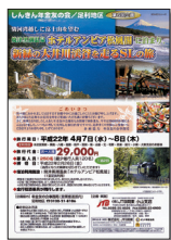
国内旅行のご案内