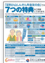
年金友の会7つの特典